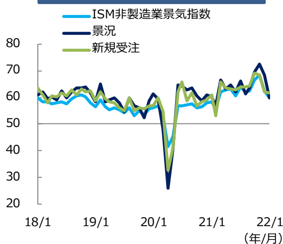
ISM非製造業景気指数の推移（1）