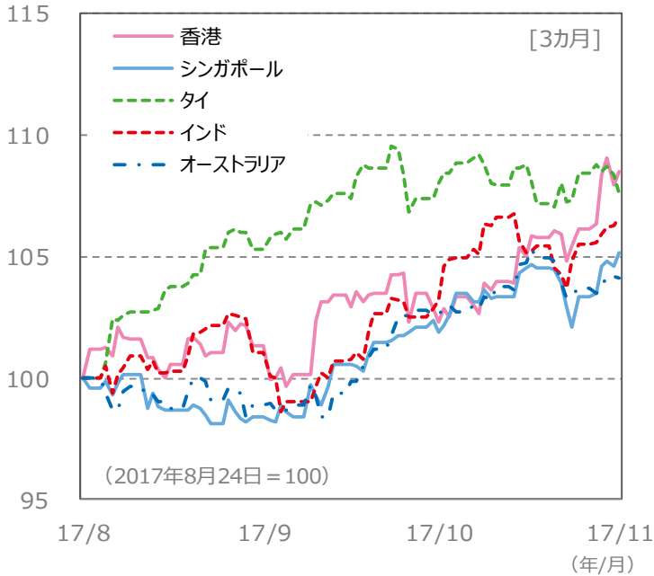
(ポイント) 【国・地域別の株価指数の推移】 [3カ月]