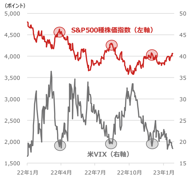
期間：2022年1月3日～2023年1月27日、日次 ・ボラティリティ・インデックスとは米シカゴ・オプション取引所が、S&P500種株価指数を対象とするオプション取引の変動率を元に算出、公表している指数。一般的に同指数の数値が高いほど、投資家の先行き不透明感が強いとされる。（別名：恐怖指数） ・○印は米VIXが20を下回りその後株価が調整した局面 （出所）Bloombergより野村アセットマネジメント作成