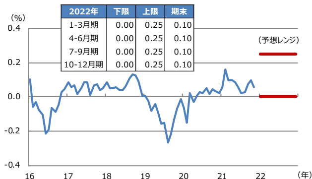
【図表2：日本10年国債利回りの予想レンジ】

(注) データは2016年1月から2021年11月。2021年12月17日時点の三井住友DSアセットマネジメントによる予想。太線は予想レンジの上限と下限。