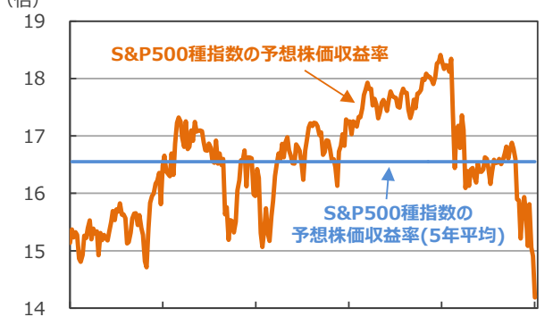
(倍) 【S&P500種指数の予想株価収益率の推移】

13/12 14/12 15/12 16/12 17/12 18/12 (注) データは2013年12月20日～2018年12月20日。週次。(年/月) (出所) Bloomberg L.P.のデータを基に三井住友アセットマネジメント作成