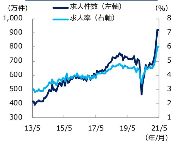
米 求人件数と求人率の推移