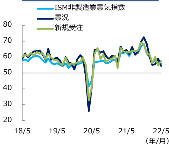
ISM非製造業景気指数の推移（1）

足もとで米国の原油先物価格が一時、約3カ月ぶりに1バレル＝120米ドル台を回復するなど商品市況の上昇基調が続くなか、製造業、非製造業ともに価格の動向に引き続き注視が必要です。