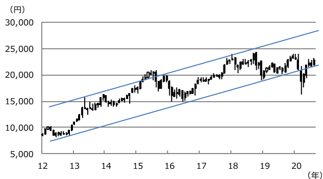
【図表2：日経平均株価の上昇トレンド】

(注) データは2012年1月から2020年8月。ローソク足は月足。ただし2020年8月は21日まで。上値抵抗線は2013年5月高値と2018年1月高値を結んだ線。下値支持線は2012年10月安値と2016年6月安値を結んだ線。