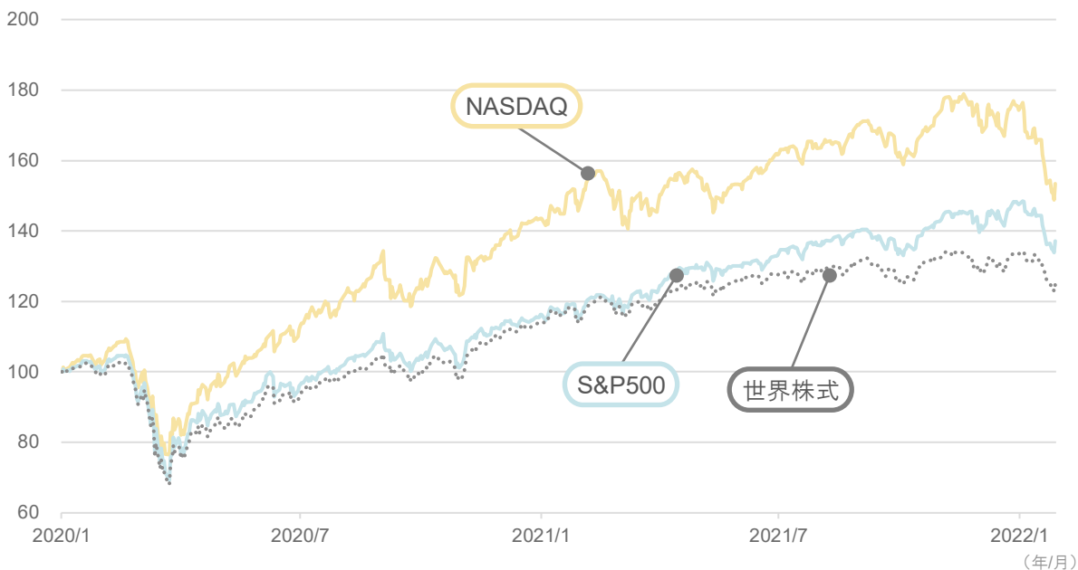
■主な株価指数の推移（期間：2020年1月初～2022年1月28日）

いつ下げ止まり・反転するかということを見通すことはできませんが、マーケットが不安定な時にこそ、あらためて確認しておきたい2つの視点をご紹介します。