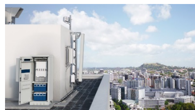
(屋上に設置されたネットワーク機器)

ネットワーク回線業者、情報技術やクラウドサービス業者、メディア向けに高性能なソリューションを提供しています。通信業界やその他の分野には、インフラやサービス、ソフトウェアを提供しています。