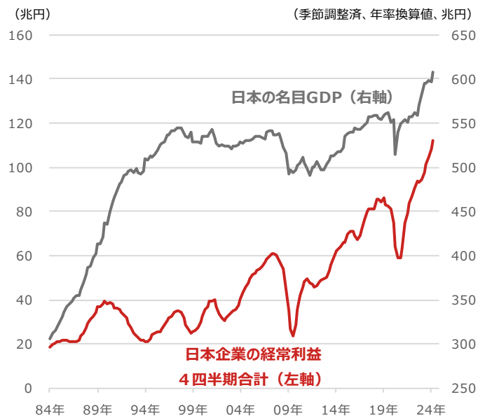
日本企業の経常利益4四半期合計と日本の名目GDP（国内総生産）

期間：1984年1-3月期～2024年4-6月期、四半期 ・日本企業の経常利益は法人企業統計のデータを用いた