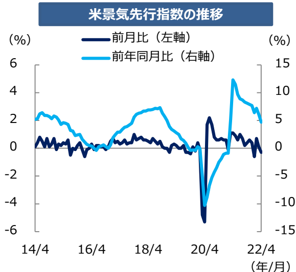
※期間：2014年4月～2022年4月（月次）

こうしたなか、25日に米連邦公開市場委員会（FOMC）議事要旨（5月3-4日開催分）が公表され、今後の金融政策動向を探るうえで大いに注目されます。