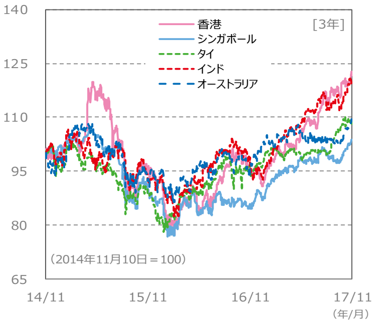
【国・地域別の株価指数の推移】