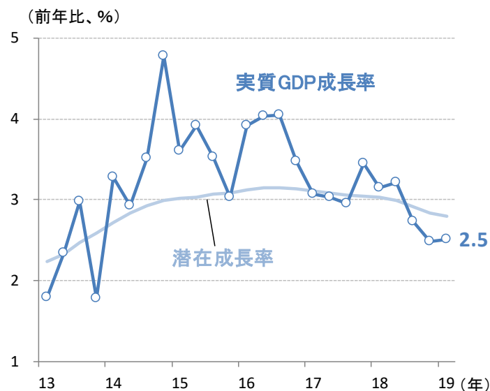
図2:ニュージーランドの実質GDP成長率の推移

(期間)2013年1-3月期~2019年1-3月期