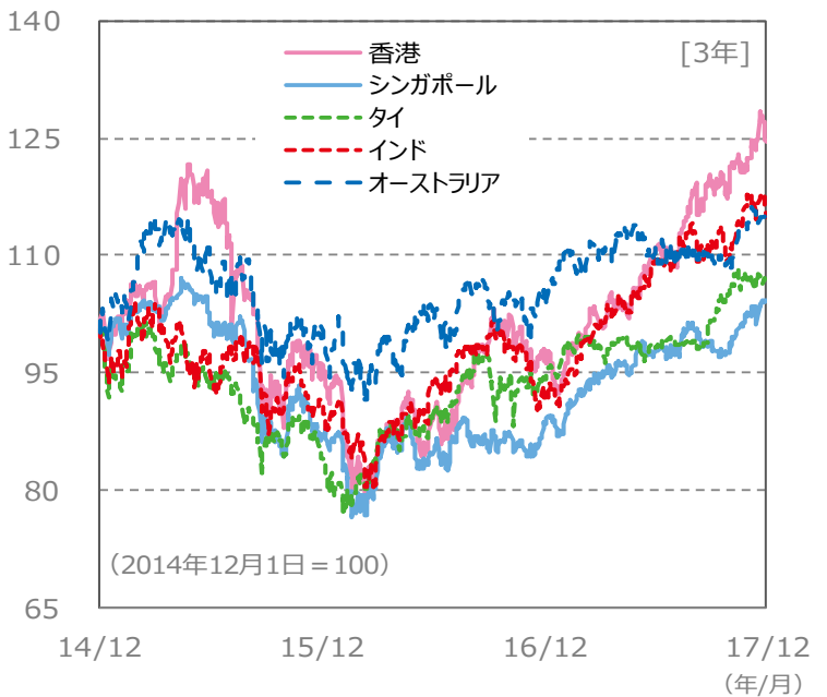
(ポイント) 【国・地域別の株価指数の推移】 [3年]