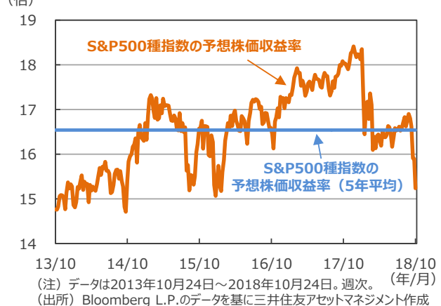
【S&P500種指数の予想株価収益率の推移】