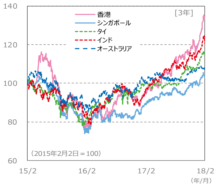
【国・地域別の株価指数の推移】