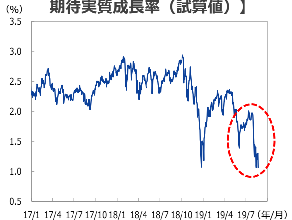
【S&P500種指数が織り込んでいる 期待実質成長率(試算値)】

(注1) 期待実質成長率は割引配当モデルに基づき試算。前提とする数値により試算値も変わるため、参考値として幅をもった解釈が必要。[試算の前提]リスクプレミアム：7.5%、リスクフリー金利：10年債利回り、長期期待インフレ：1.8%。 (注2) データは2017年1月1日～2019年8月23日。 (出所) Bloomberg L.P.のデータを基に三井住友DSアセットマネジメント作成