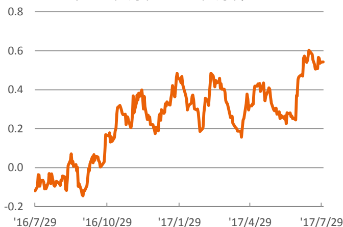
ドイツ10年国債利回りの推移 (%) (2016年7月末～2017年7月末)