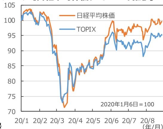
(ポイント) 【日経平均株価、TOPIXの推移】

(注) データは2020年1月6日～2020年8月31日。