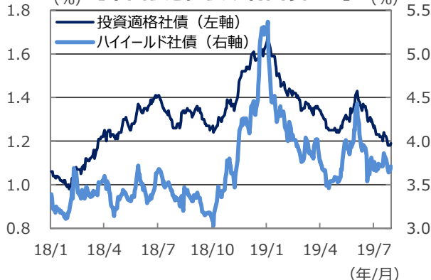
【米国債と社債の利回り格差】

(注1) データは2018年1月1日～2019年7月30日。 (注2) 対国債利回り格差は、社債利回りと国債利回りの差。Bloombergパークレイズ米国社債指数ベース。 (出所) Bloomberg L.P.のデータを基に三井住友DSアセットマネジメント作成