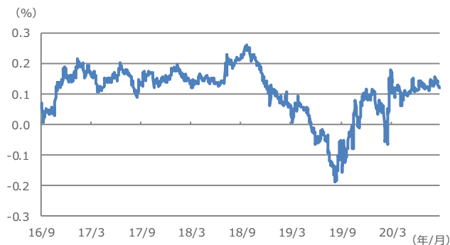
【図表2：日本の長短金利スプレッド】

(注) データは2016年9月21日から2020年9月15日。2016年9月21日は日銀が「長短金利操作付き量的・質的金融緩和」の導入を決定した日。短期金利は日銀当座預金の政策金利残高に適用されるマイナス0.1%、長期金利は10年国債利回り。