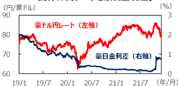
【豪ドル円レートと豪日金利差】

(注) データは2019年1月1日～2021年12月7日。 豪日金利差は2年国債利回りの差。 (出所) Bloombergのデータを基に三井住友DSアセットマネジメント作成