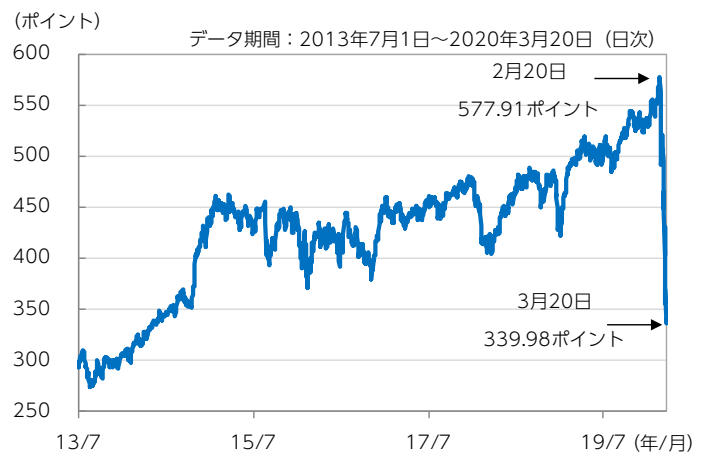
図表1：グローバルREITの推移