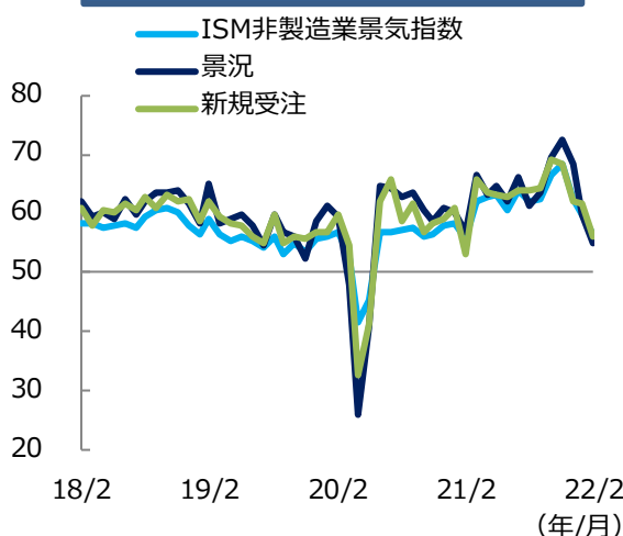
ISM非製造業景気指数の推移（1）

ロシアのウクライナへの侵攻が世界経済に与える影響には留意が必要であるものの、足もとの米国経済の拡大基調が続くなか、製造業、非製造業ともに供給や価格などの動向に引き続き注視が必要です。