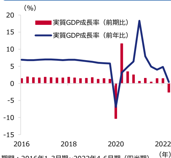
図表1 中国の実質GDP成長率の推移

期間：2016年1-3月期～2022年4-6月期（四半期） 出所：リフィニティブのデータを基にアセットマネジメントOneが作成